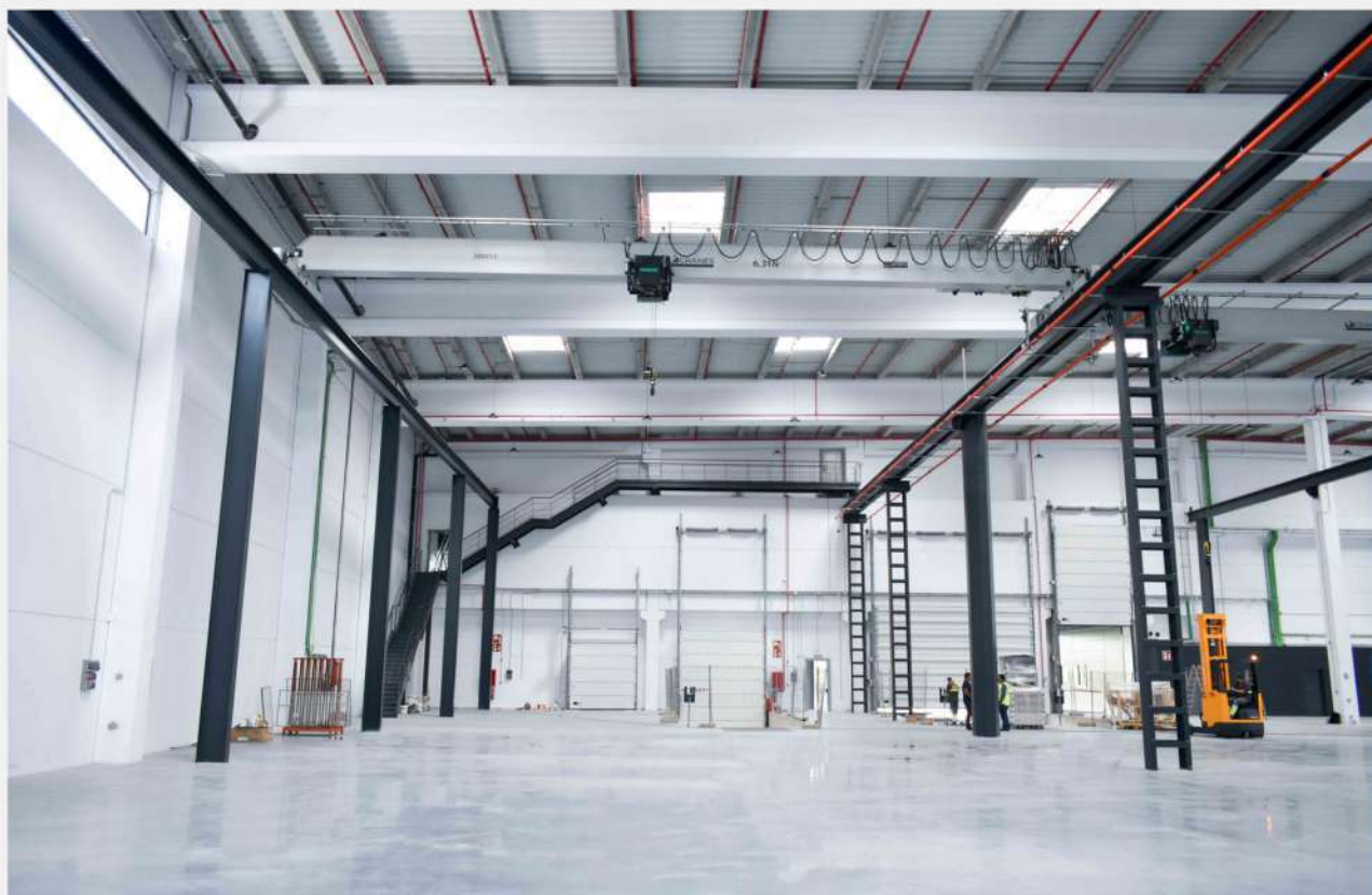
Puente grúa monorraíl 6.3Tn, en una revisión de mantenimiento.