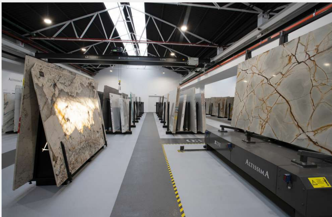
Instalación puente grúa birraíl 3.2Tn