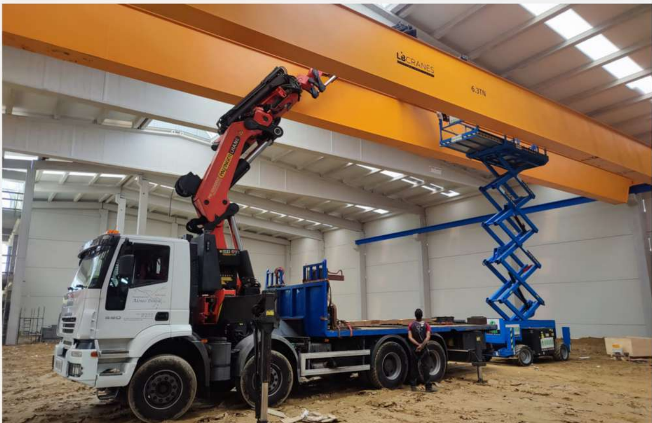
Instalación puente grúa birraíl 6.3Tn