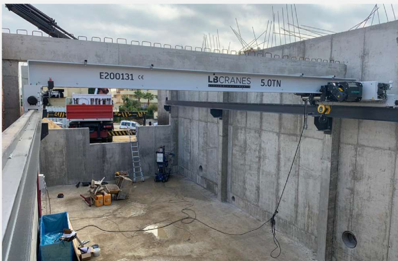
Instalación puente grúa monorraíl 5Tn